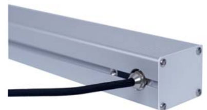
A la demande du client, le connecteur standard peut être remplacé par une autre solution sur mesure.

AVEZ-VOUS BESOIN DE PLUS D'INFORMATIONS? ADRESSEZ-VOUS A NOUS. NOUS VOUS AIDERONS AVEC PLAISIR. APPELEZ LE +420 222 312 917 OU ECRIVEZ A INFO@DOUBLEPOWER.CZ .