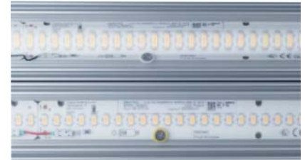
Les luminaires utilisent des bandes DEL fiables Samsung LM301B avec température de couleur sélectionnable de 2700 – 6500K. Le système optique permet de choisir parmi toute une palette de caractéristiques de rayonnement.