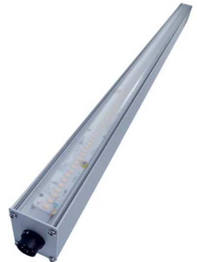
Le profilé en aluminium de qualité avec ailettes latérales permet une évacuation rapide de la chaleur. Cache avant disponible en version transparente ou à diffusion.