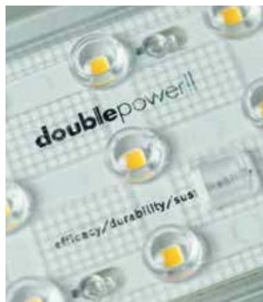
Le luminaire utilise des blocs LED de haute qualité aux températures de couleur de 2700K à 6500K.