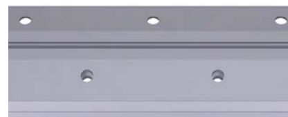
Les orifices soigneusement calculés et conçus dans le profilé du luminaire augmentent encore davantage l'efficacité du refroidissement.