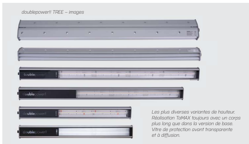
Les plus diverses variantes de hauteur. Réalisation TaMAX toujours avec un corps plus long que dans la version de base. Vitre de protection avant transparente et à diffusion.