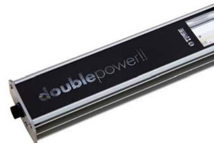
Les inscriptions transparentes dévoilent quelle électronique est utilisée dans le luminaire.

La durée de vie L80B10 pour luminaire doublepower!! TREE est de 100 000 heures. Un important paramètre pour la durée de vie de LXXBXX est la température ambiante. L80B10 du luminaire doublepower!! SKY d'une valeur de 100 000 heures est valable pour Ta +50°C, et de +65°C pour la version TaMAX.