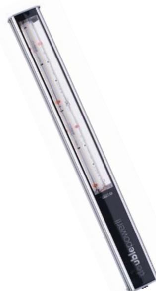
Design et conception compacts. Et parmi les meilleures paramètres thermiques du marché.