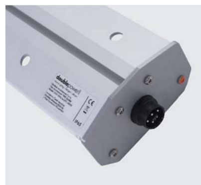
Le connecteur IP68 et l'écrou M6 préinstallés dans la rainure permettent une installation rapide et variable.